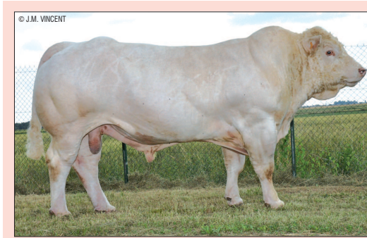
■ Un très fort IFNais (116) un DM de 103 et un ISVR de 104 font de VOLCAN (un nom prédestiné) le taureau à mettre sur génisses qui manquait au GIE. Il provient d'un élevage du Calvados ce qui constitue en terme d'approvisionnement une petite révolution. Les doses seront disponibles à la fin de l'automne (contacter le GIE au 04.73.44.46.00).

Par contre, cela n'est pas toujours compatible avec la recherche de facilités de naissances. L'Avel (aptitude au vêlage) et l'IFNais (index facilité de naissance) sont, à de rares exceptions, en opposition. Une politique axée uniquement sur la recherche de facilités de naissance est contraire aux objectifs recherchés car au bout de quelques générations les aptitudes au vêlage se dégradent fortement et le problème légitime de départ (moins de travail de l'éleveur autour du vêlage) se repose. Il s'agit donc pour le GIE de proposer un (des) taureau(x) pour mettre sur génisses, inciter les éleveurs à ne pas garder les filles de ces génisses -à quelques exceptions près- et faire la promotion des autres taureaux en amenant